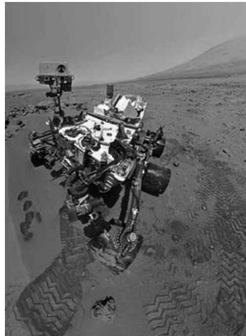
Imatge del Curiosity al cràter Gale, a la superfície de Mart (31 d'octubre de 2012)

DADES: Massa de Mart, M_{\text{Mart}} = 6,42 \times 10^{23}\text{ kg} . Radi de Mart, R_{\text{Mart}} = 3,39 \times 10^6\text{ m} . G = 6,67 \times 10^{-11}\text{ N m}^2\text{ kg}^{-2} .